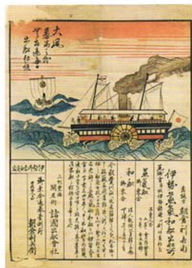
「三州豊橋関屋街 諸国出船会社引札」

本展覧会では、伊勢湾を横断する海の街道ならびに、伊勢湾を航行した船や海の文化、旅人の楽しみであった伊勢名物を紹介します。