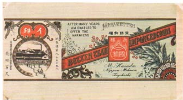
煙草包装紙「国竹 イ印」

刷物(すりもの)とは、辞書をみると「版木を用いて刷ったもの。また、一般に、印刷物」とあります。江戸時代の俳句と絵を組み合わせたものなどを思い浮かべますが、今回の展覧会では印刷物一般をさしています。明治時代から昭和戦前まで豊橋に関する印刷物を5つのテーマに分けて展示します。