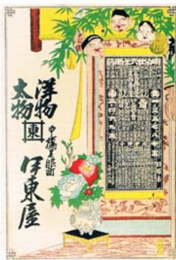
引札「豊橋呉服町 伊東屋」 明治25年