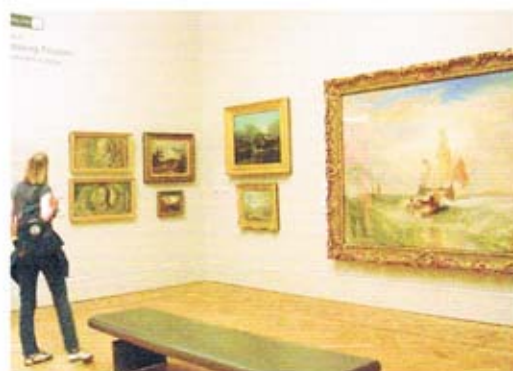
展示室（右端はターナー）

イギリスの美術館では、コレクション展は無料で見ることができる。代わりに「観覧無料」を維持するための寄付を呼びかける募金箱を設けている。そして、子どもたちへの普及活動に力を入れており、ロンドン市内の美術館でもクラス単位で見学に来ている様子をたびたび見かけた。学期末であるこの時期に学外活動として美術館見学を組み込む学校が多いという。自習用のワークシートや体験コーナー、ワークショップ開催のための「Education Room」など、館の規模を問わず充実した支援ツールを備えているため、きっかけは学校行事としてであっても、その後自主的に美術館へ行く仕組みが整っているのは見事である。