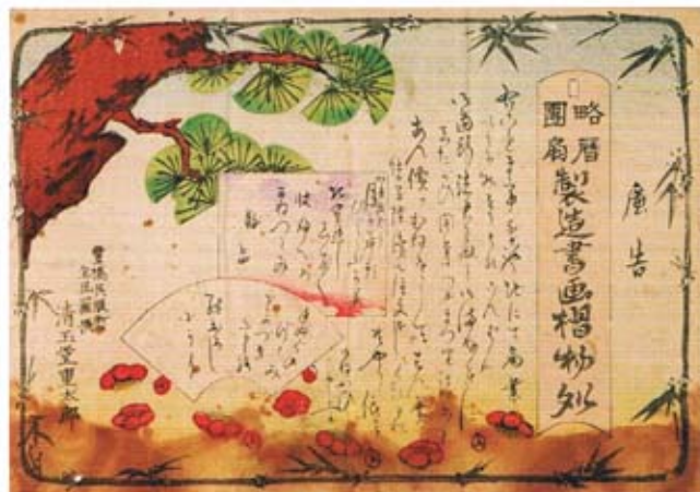
引札「豊橋呉服町 清玉堂重太郎」 明治時代

これら正月用引札は、大阪の大手業者が大量に石版印刷したものが多かったと思われる。各商店では見本の中から好きな絵を選んで、余白に取扱商品や店名などを刷り足