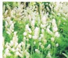
ミカワバイケイソウ