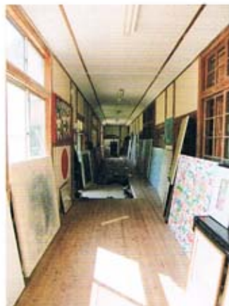
回廊に並べられた作品

さ、そして自然の美しさをテーマに描く画伯は、殉教者にまつわる悲惨な歴史と穏やかな美しい自然が同居する久賀島に心ひかれ、この地を日本での制作拠点に定めたという。本拠地としている地中海のコルシカ島は太陽の光、久賀島は月の光と表現し、一年で一番厳しい季節の11月から2月に久賀島に身を置き、原点に戻った気持ちで制作活動に向かっておられることにも感銘を受けた。