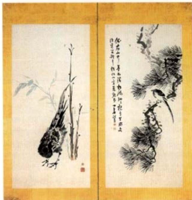
松竹図屏風(渡辺小華・田村幹筆)

の経営帳簿や、問屋場で記録された公文書など幕末期の二川宿の様相を知ることができる貴重な資料群で、平成17年度に二川宿本陣資料館に寄贈されました。