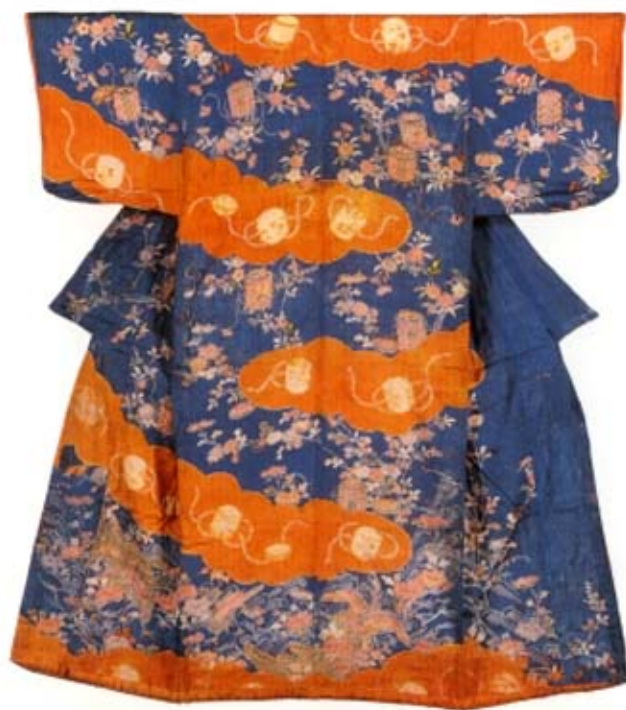
納戸縮緬地雲取に貝桶と花鳥文様小袖 江戸時代中期～後期(18世紀後期)

本展では、京都の友禪染の代表的な老舗のひとつ、千總(ちそう)が所蔵するコレクションを紹介しています。展示は、Ⅰ近代の千總、Ⅱ小袖コレクション、Ⅲ屏風コレクションの3部構成となっており、江戸時代から明治時代のきもの、近代の友禪染裂や美術染色、円山応挙や岸竹堂など京都画壇を代表する作家たちの絵画作品が展示されています。秋の一日、京都を舞台に花開いた優雅な美の世界をお楽しみください。