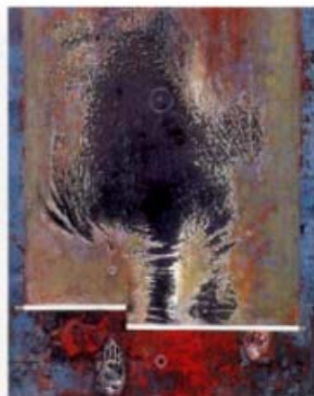
星野眞吾「掌相<絶筆>」 1997(平成9)年 星野の絶筆。中央の陰影は掌を拡大したものである。晩期にみせた人拓画の新たな展開であった。

また、本年は正義の朋友でもあった星野眞吾・没後10年でもある。画塾に学び、日展の反逆児として挑発的な活動を展開した正義と、京都市立絵画専門学校に学び、パンリアル美術協会を結成して当初より前衛活動を繰り広げた星野とは、スタンスも画風も全く異なるものの、伝統や因習に抗いながらも日本画にこだわり、抽象表現主義隆盛のなかでも絵画表現を放棄しない、という点で近しい存在であった。実際、旧制中学時代の出会いにはじまり、日本画研究会、从会結成など、折に触れて歩みを同じくしている。74歳で没した星野は、視力・体力が衰える晩期においても自らの生み出した“人拓”に安住せず、最期まで新たな表現を求めて果敢に挑んだ「前衛」画家であった。