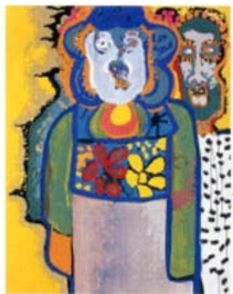
中村正義「男女」 1963(昭和38)年 背後に何者かがたたくも横顔がすでにみられる。ここでは女の影で小さくなっていく男の姿をコミカルに描く。