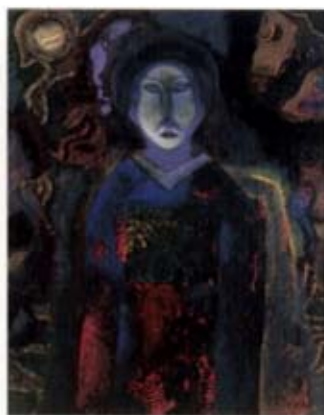
中村正義「舞妓」 1976(昭和51)年 「男女」の展開を示す晩期の代表作。背後には太陽と月のような模様を描かれ、陰陽の対比がなされている。